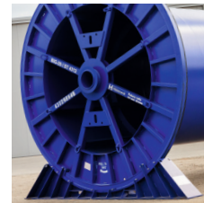
Équipement de manutention