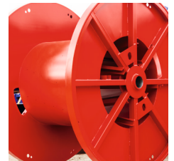
Tourets pour machines avec entretoises de noyau