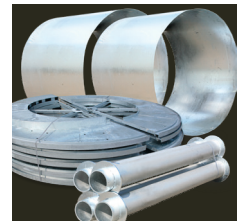
kits optimisés pour le transport

Nous fabriquons des tourets en acier avec un diamètre de joue de 630 mm à 10 000 mm et supportant jusqu'à 250 tonnes de charge utile.